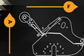
Apertura dell portón hidráulico de 550 mm.